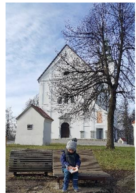
Slika 3: Cerkev Sv. Trojice na Vrhniki