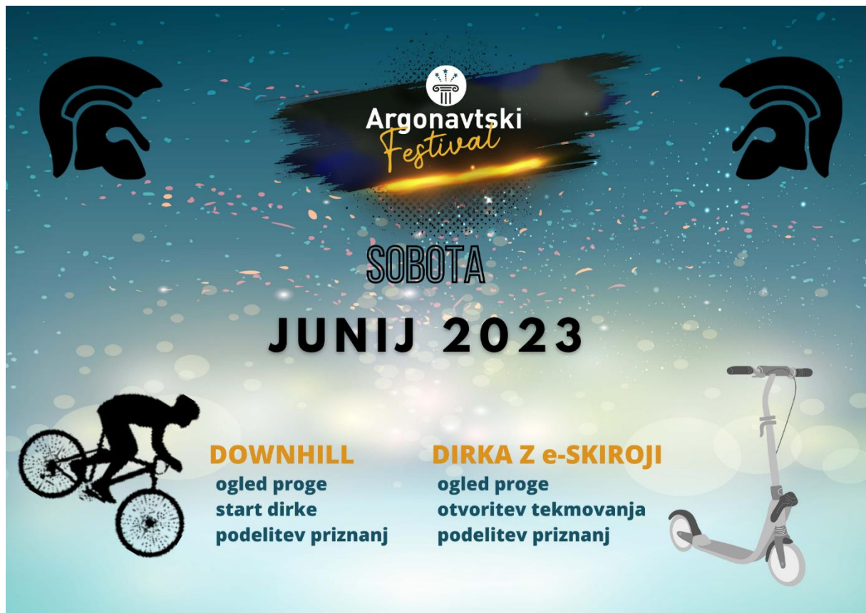
Slika 4: Reklamni plakat