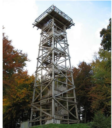
Slika 2: Razgledni stolp na Ulovki - Planina nad Vrhniko