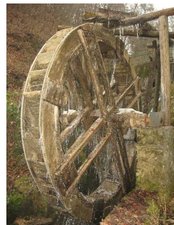
Slika 1: Mlinsko kolo v Starem malnu