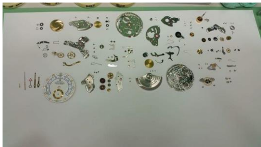
Razstavljeni mehanizem ročne ure